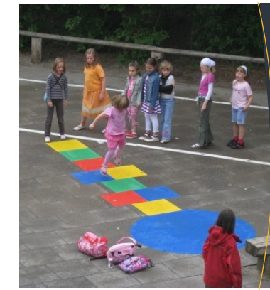
Pausenspiele auf unserem Schulhof

Wichtig ist aber auch, dass Sie die Zeit bis zum Schuleintritt im Bedarfsfall nutzen. Jetzt ist noch genügend Zeit für Sprachunterricht in der KITA, Logopädie oder Ergotherapie.