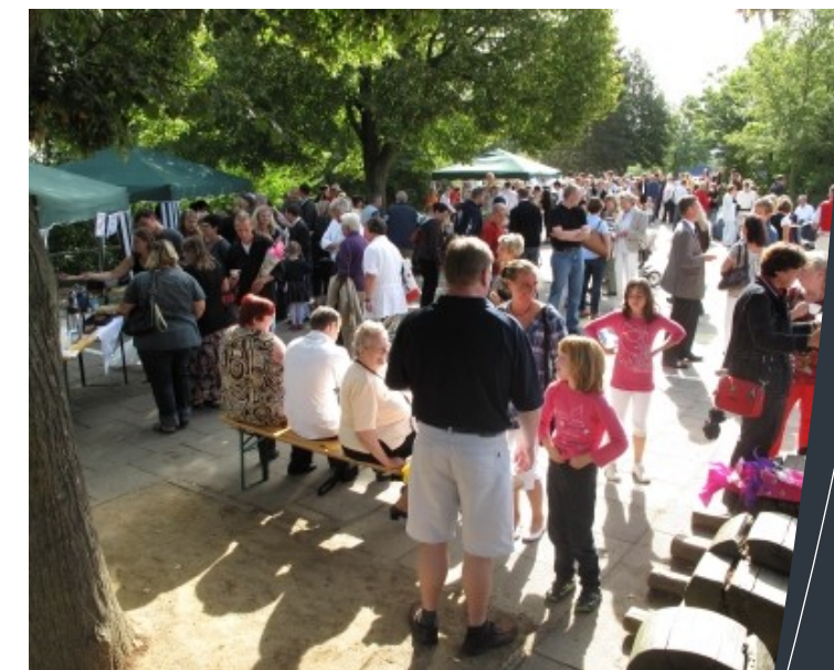
Einschulung 2009: Die Schulanfänger sind in den Klassen. Der Schulverein lädt die Familien zu Kaffee und Kuchen ein.