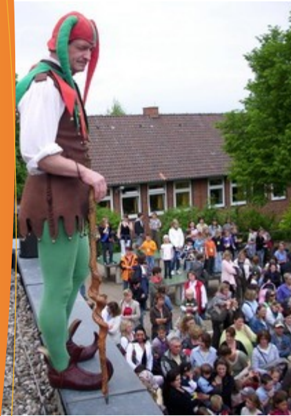
Till Eulenspiegel begrüßt die Gäste des Schulfestes 2009.

Wecken Sie das natürliche Interesse Ihres Kindes an der Schule. Reden Sie mit Ihrem Kind über die Schule und die Dinge, die es dort tun wird: singen, malen, spielen, turnen, neue Freunde kennen lernen, schreiben, lesen, rechnen. Wir laden Ihr Kind im Frühsommer im Rahmen von Kindergartenbesuchen ein, es nimmt an einer Schulrallye und an einer ersten Unterrichtsstunde teil. Lassen Sie sich davon berichten.